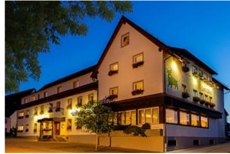
Gasthof-Hotel Zum Ochsen