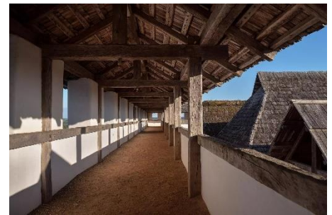
Heuneburg – Stadt Pyrene