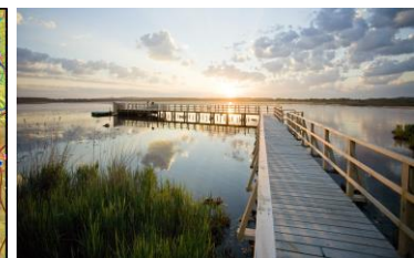
Federsee Bad Buchau