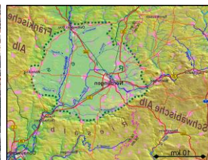
Nördlinger Ries (Kratereinschlag)