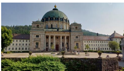
St. Blasien Dom

Urig, ursprünglich, urzeitlich. Nur die Saurier fehlen. Auf der Alb haben die Urmenschen damit begonnen, kulturelle Formen zu entwickeln. 40.000 Jahre später kann man nur stauen, was daraus geworden ist. Sechs Alb-Höhlen zählen zum UNESCO Weltkulturerbe. Im Mittelalter ließen die Herrscher an den schönsten Punkten Burgen und Schlösser errichten. Wilde Täler, bizarre Aussichtsfelsen, tiefe Karsthöhlen, eigenartige Wacholderheiden – die imposante Landschaft ist gespickt mit Sehenswürdigkeiten.